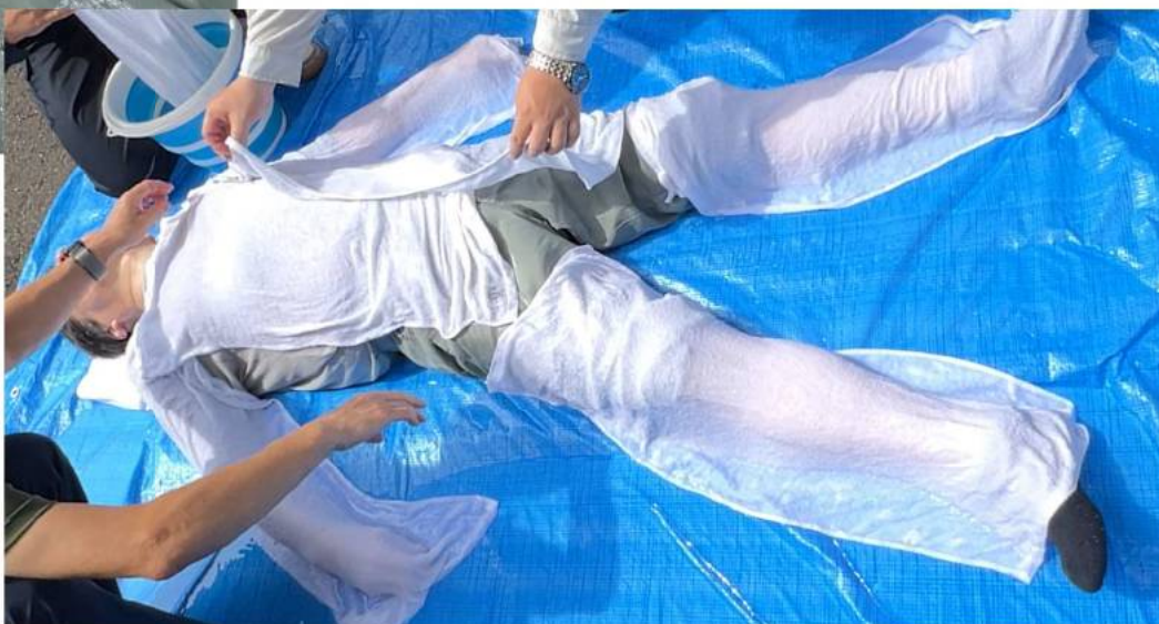
氷水でタオルを濡らして身体を冷やす ※体温で温まったタオルを交換しながら行う