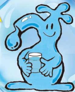
広島市水道局マスコットキャラクター じゃくつちー